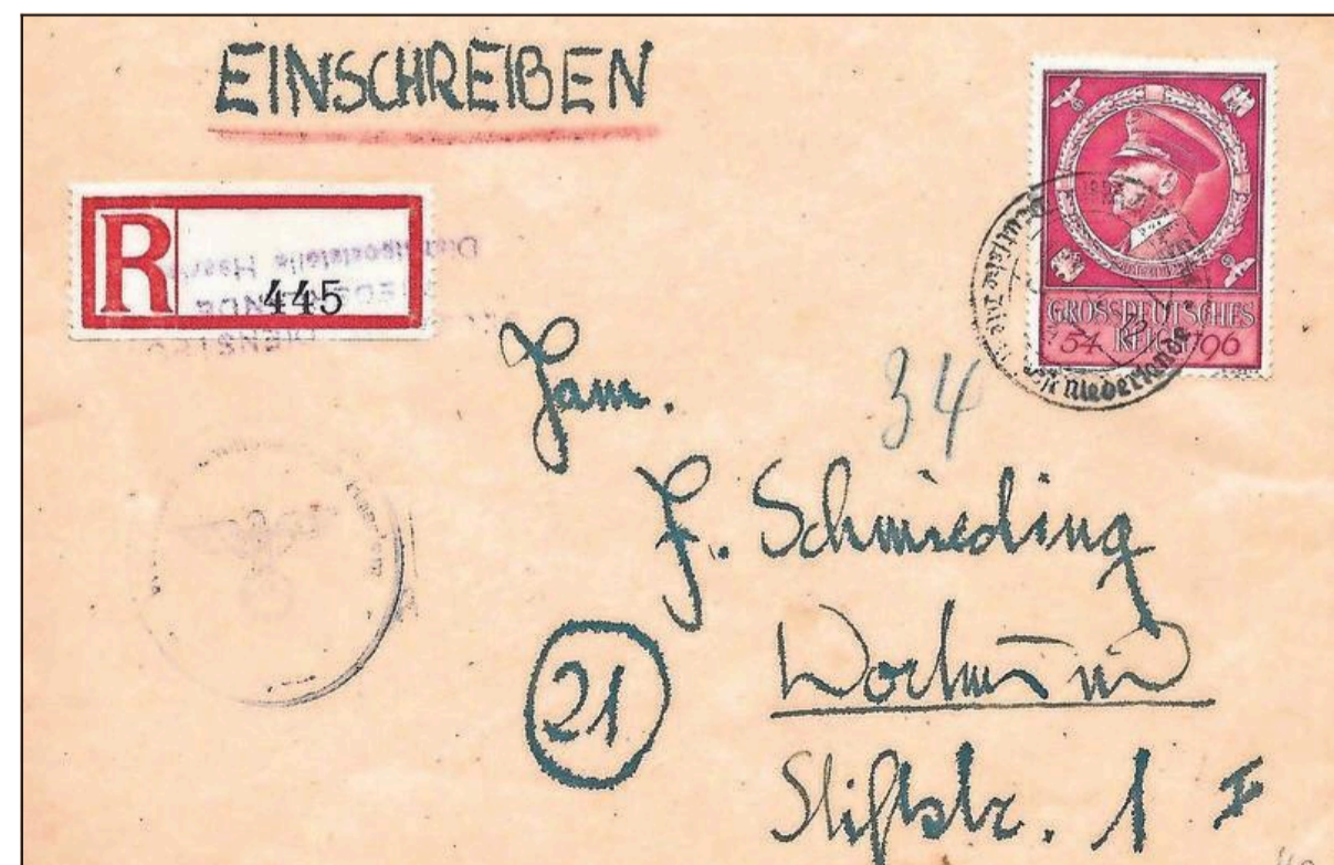
Een dienstbrief van een Duitse commandant naar het thuisfront, met Hitler-zegel en Haarlems poststempel.

tisme uit, omdat alleen de beter gesitueerden konden lezen en schrijven. En het zich konden veroorloven post te versturen. Pas vanaf de jaren twintig wordt het een massaproduct. Dan worden ontwerpen moderner en kom je opeens art deco en de Amsterdamse school tegen. Eigenlijk leest zo'n verzameling als een geschiedenisboek.” Op Hoop van Zegels is dan ook begonnen om de posthistorie van Haarlem en omstreken online te zetten op hun site www.ohvz.nl .