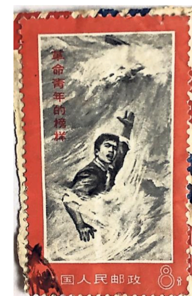
Een zwemmende Mao.

'Hokjesplakkers' en historici gaan hand in hand bij filatelievereniging