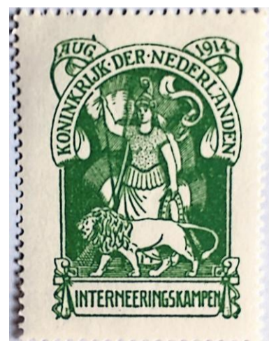
Zegel uit Belgisch interneringskamp.

Ook binnen zijn vereniging werd de sfeer er destijds niet beter op. Zo doken vervalsingen op en werd uit elkaars collectie gestolen. „Dan miste iemand opeens drie zegels als een ander lid bij hem thuis was geweest. Diep triest. Vunzigheid is