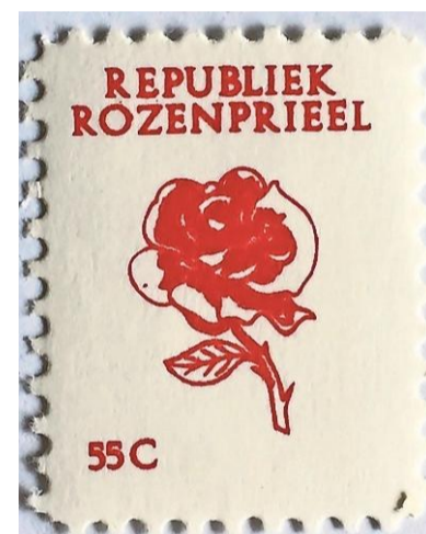
1979: eigen zegel Rozenprieel.