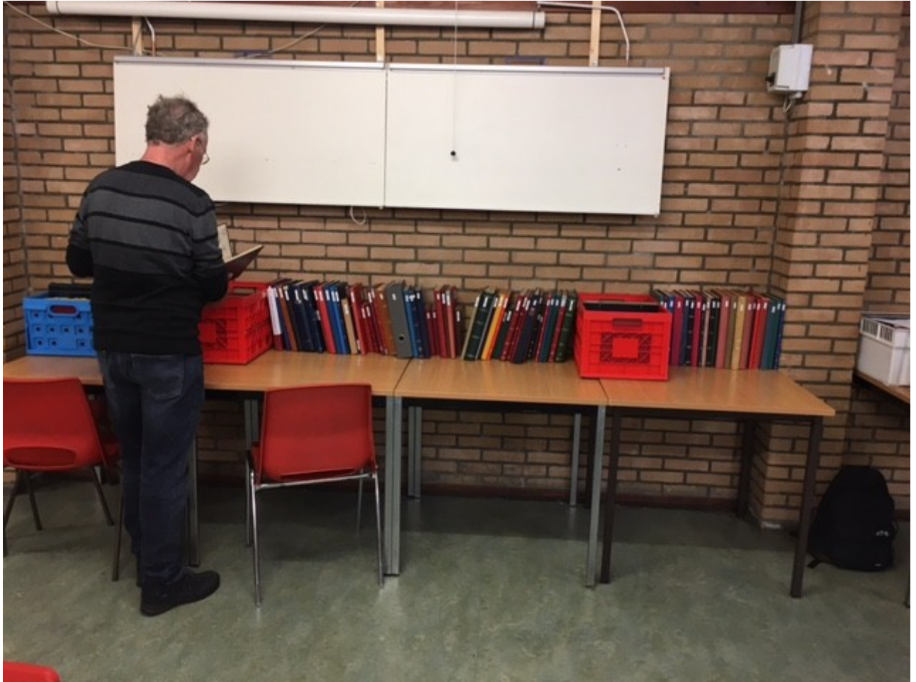
De 5-cent boeken van OHvZ staan klaar om te worden besnuffeld.