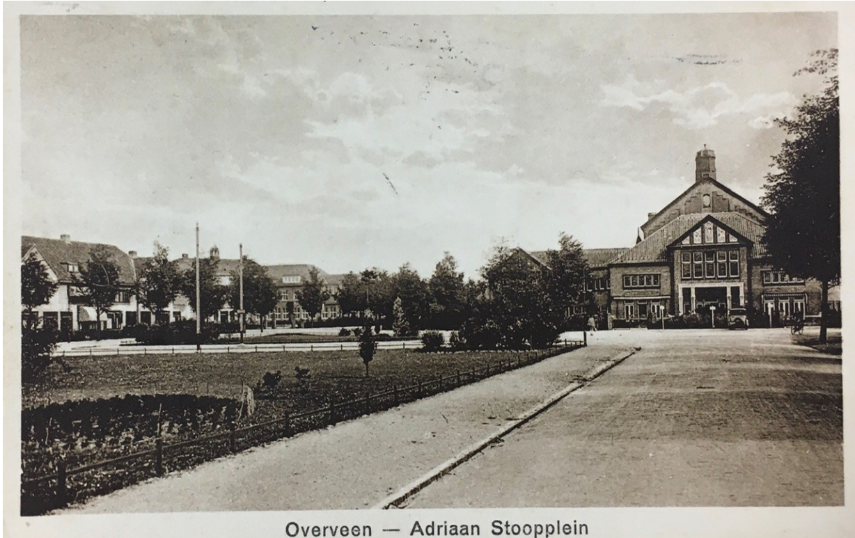
Overveen — Adriaan Stoopplein