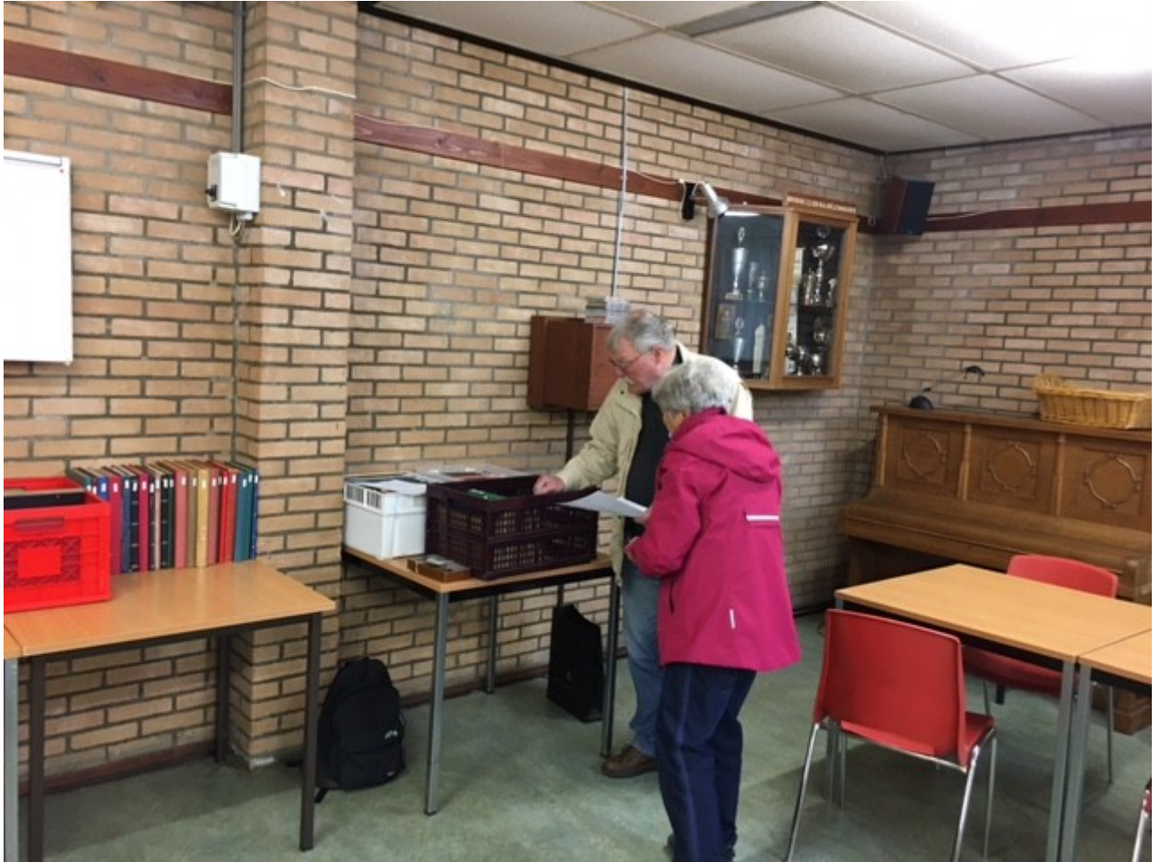
Ook Statuut '80 uit Amsterdam had een eigen hoekje