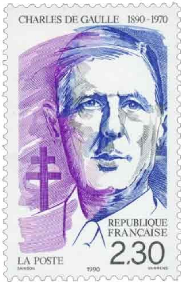
De FDC heeft de volgende eerste dag stempel. (Y3401)