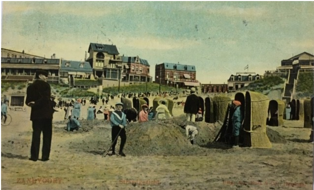
(strandplezier in Zandvoort in 1899!)