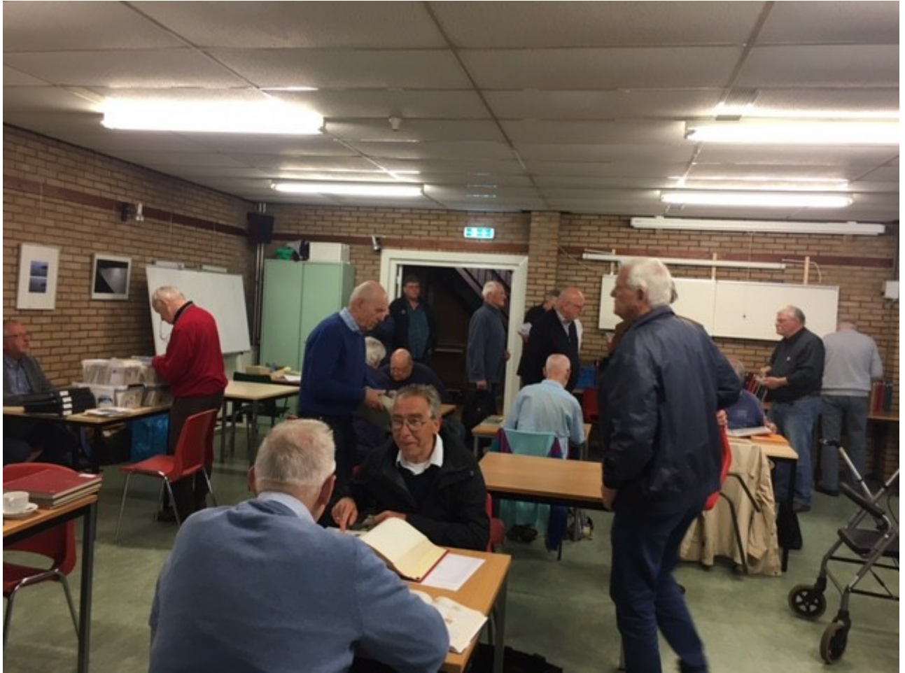
Snuffelen en overleggen