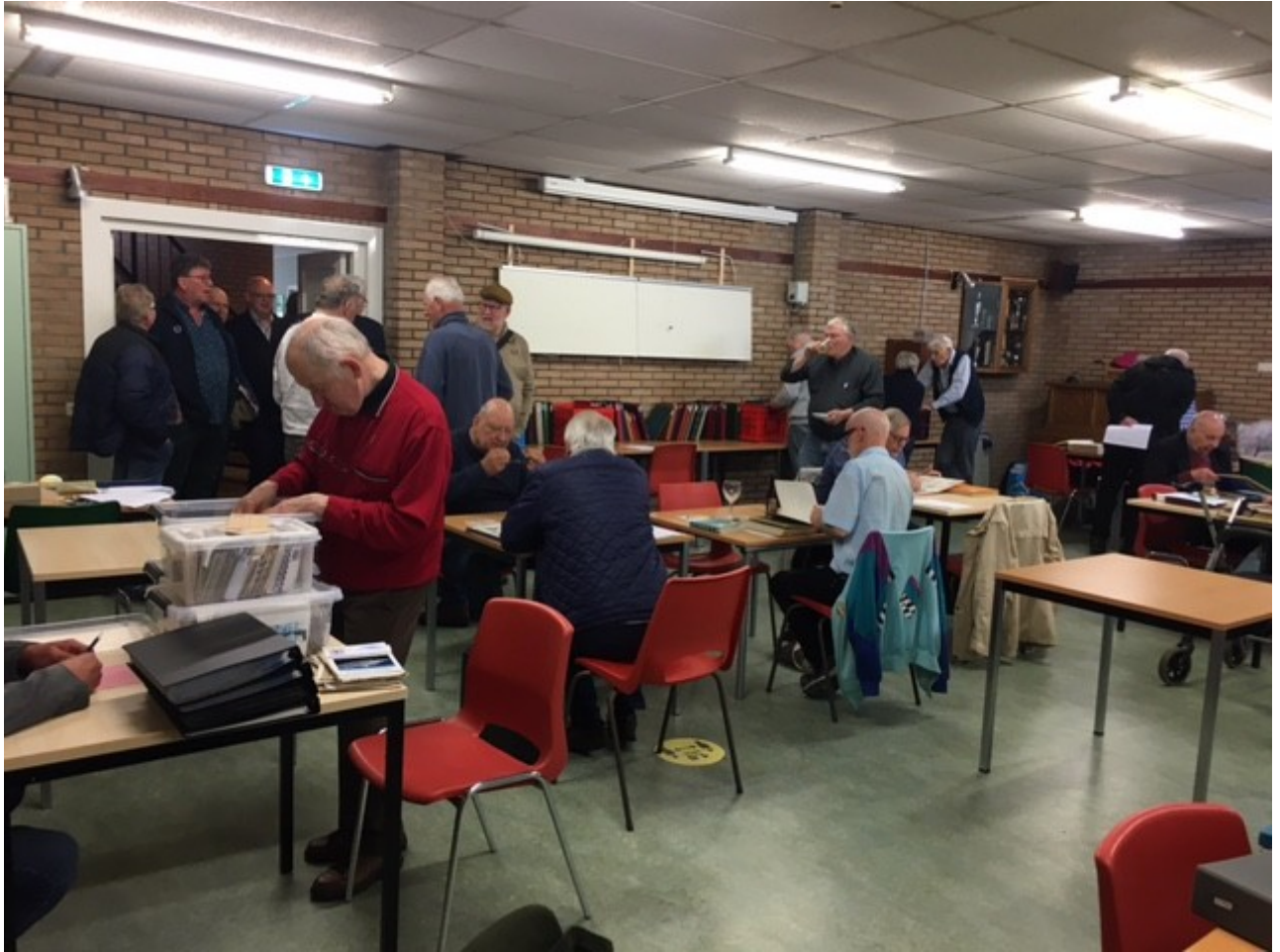
De deuren gaan open en het was meteen druk bij binnenkomst