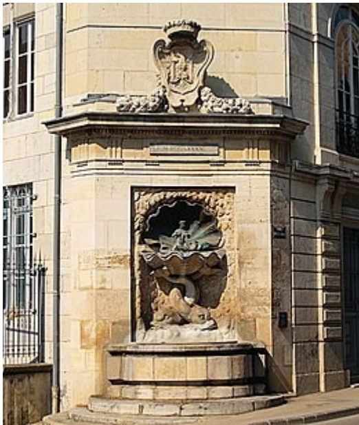
Fontaine des Innocents à Paris (Y2008)

De decoratie van de fontein, omgeven door concreties (bolvormige of ovale, geïsoleerde vorm uit formaties van afzettingsgesteente) geïnspireerd op die van de grot van Osselle, stelt twee met elkaar verstrengelde dolfinen voor die een schelp ondersteunen waarop een zeemeermin zit wiens water uit de borsten gutst. Dit bronzen beeld, toegeschreven aan Claude Lullier, is afkomstig uit een oude fontein van het Granvelle Palace, gebouwd tussen 1542 en 1546 in het midden van de binnenplaats.