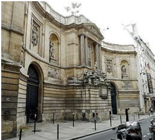
Fontaine des Dames à Besançon (Y3387)

Een belangrijke Latijnse inscriptie ter ere van Lodewijk XV overstijgt een beeldhouwde groep. De voorbijganger is in eerste instantie verbaasd en ziet niet direct de aard van de fontein van het monument. De vier bronzen mascarons (maskers), welke het hoofd van een zeemonster voorstellen, gesitueerd op de basis vijftig centimeter boven de grond, springen het eerst in het oog.