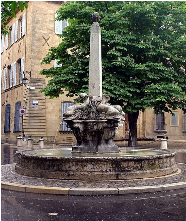
Fontaine du Parc floral de Paris (Y2009)

In 2015 is de fontein van de Vier Dolfijnen gerestaureerd.