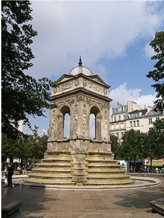
Fontaine des Quatre-Dauphins de Aix-en-Provence (Y3777)

Van het kerkhof is vandaag de dag weinig terug te vinden; enkel een plein verwijst nog naar deze plek. Op de Square des Innocents staat de Fontaine des Innocents (1549), een zorgvuldig gerestaureerde renaissancefontein. De fontein is een populair ontmoetingspunt voor jongeren en is een van de symbolen van Les Halles.