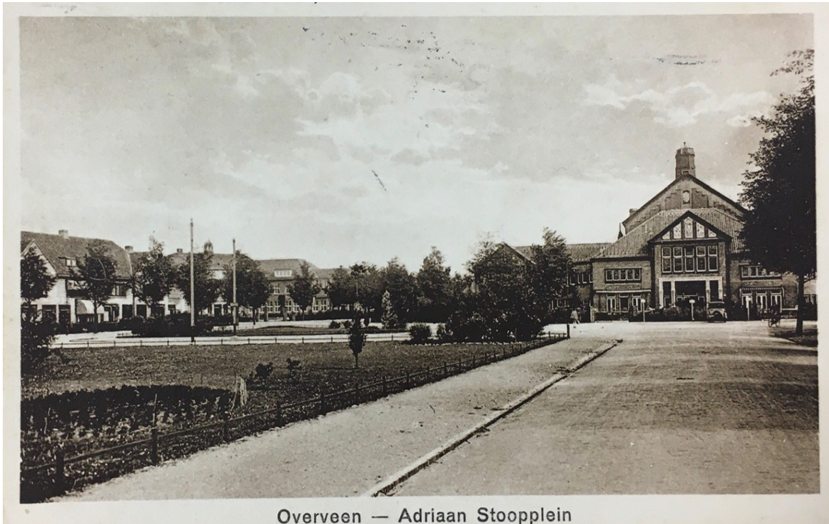
Overveen — Adriaan Stoopplein

het klaar om voor dezelfde handeling nu 1,01 euro te rekenen. Dat is dus aanzienlijk meer dan de 'gewone inflatie' in die ruim 85 jaar!